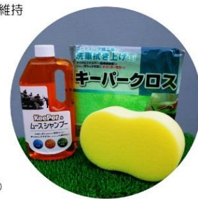
Car coating 365 (1年耐久コーティング)